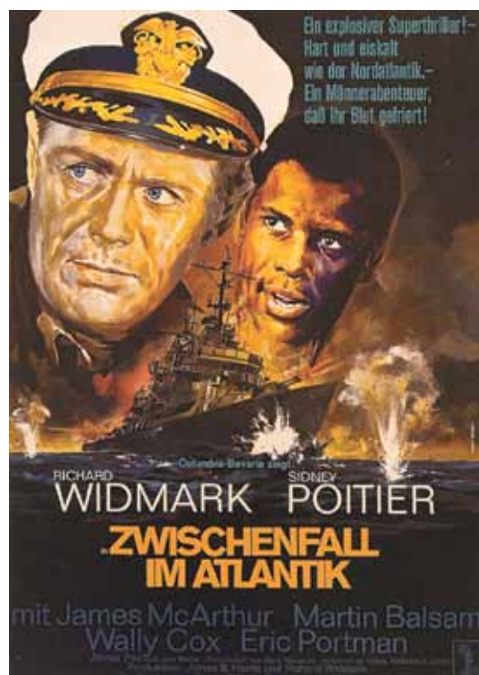
Den tyska bioaffischen för The Bedford Incident (1965).

I Ubåt anfaller står kampen dels mellan kommandörkapten Richardson (Clark Gable) och den japanska jagare som sänkt hans första ubåt, dels mellan Richardson och hans närmaste man, kapten Bledsoe (Burt Lancaster). De är nära vänner, men relationen når bristningsgränsen då Bledsoe ställer sig på besättningens sida och övertar befälet. Richardsons likheter med den besatte kapten Ahab i Moby Dick visar sig dock vara skenbara, eftersom hans agerande utgått från de order han fått. Därtill blir han allvarligt sårad i en strid mot japanerna. Skadan var en eftergift åt Cable som, van vid att spela hjälteroller, inte kunde acceptera att hans rollkaraktär blev utsatt för ett myteri utan någon underliggande förklaring.