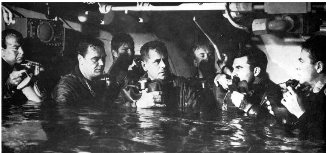
Glenn Ford och hans mannar i ett laddat ögonblick i Sista torpeden .

Just relationen mellan ubåtskaptenen och hans närmaste man är ett omhuldat tema i ubåtsfilmerna. En anledning till dess popularitet är släktskapet med kammarspelet. I ubåtens trånga utrymme är möjligheterna stora att fokusera på frågor om ledarskap. De centrala temana är vilka offer som man måste vara beredd att göra om man skall vara en duglig befälhavare och vilka egenskaper som hans närmaste män måste förvärva för att de så småningom skall bli dugliga ubåtschefer.