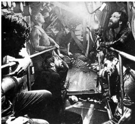
Das Boot . Den klaustrofobiska känslan är märkbar. Filmen om U96:s öden och äventyr blev en av de mer framgångsrika krigsfilmer under senare tid. Filmen öppnade dörren till Hollywood för regissören Wolfgang Petersen.

Många av de krigförande länderna har uppvisat ett betydligt större intresse för ubåtsdramer. I Tyskland spelades ett antal filmer under 1920-talet som anspelade på tyska ubåtsframgångar och -hjältar under första världskriget såsom Den sjunkna flottan (Die Versunkene Flotte, 1926) och Havets marodörer (U 9 Weddigen, 1927). Under andra världskriget lanserades ubåtskaptenerna som några av Tysklands främsta hjältar i journal- och spelfilmer, inte minst efter att U 47 med Günther Prien som befälhavare sänkt det brittiska