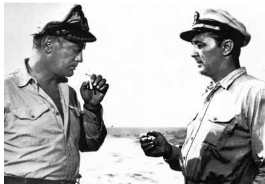
Ubåtsfilmer fokuserar på manliga relationer och slutar ofta som i Fienden i djupet där Curd Jürgens och Robert Mitchum möter varandra med ömsidig respekt och beundran.

slagskeppet Royal Oak i flottbasen Scapa Flow.